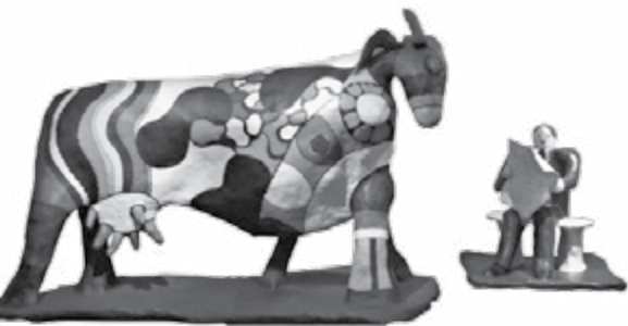
l'Oeuvre de Niki de Saint Phalle