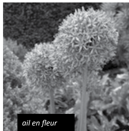
ail en fleur

S'il vous reste des racines d'endives, de carottes et de poireaux, repiquez-les dans vos massifs et laissez les monter en fleurs. Les poireaux porteront des têtes rondes étoilées, les carottes feront de jolies ombrelles et les endives de jolies fleurs bleues.