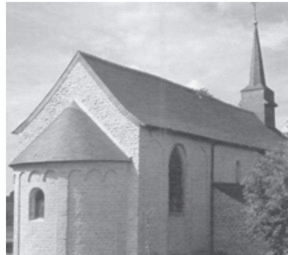
Frasnes les Gosselies : Notre Dame du Roux

Cette période très fertile en événements aura aussi son exposition florale-une exclusivité- et une soirée culinaire. Le soixantième anniversaire du Cercle Laïc se fêtera ainsi dans le plus grand éclat.