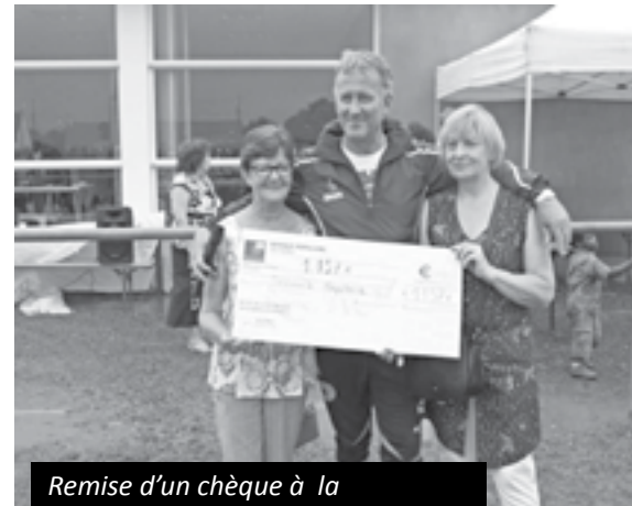
Remise d'un chèque à la représentante du Secours Populaire

au Secours Populaire «afin que des enfants puissent aussi partir en vacances» .