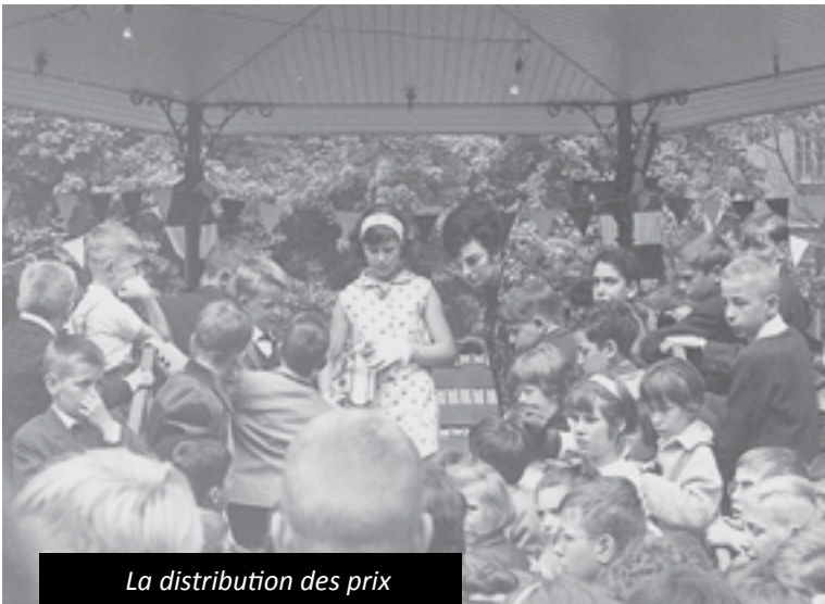
La distribution des prix