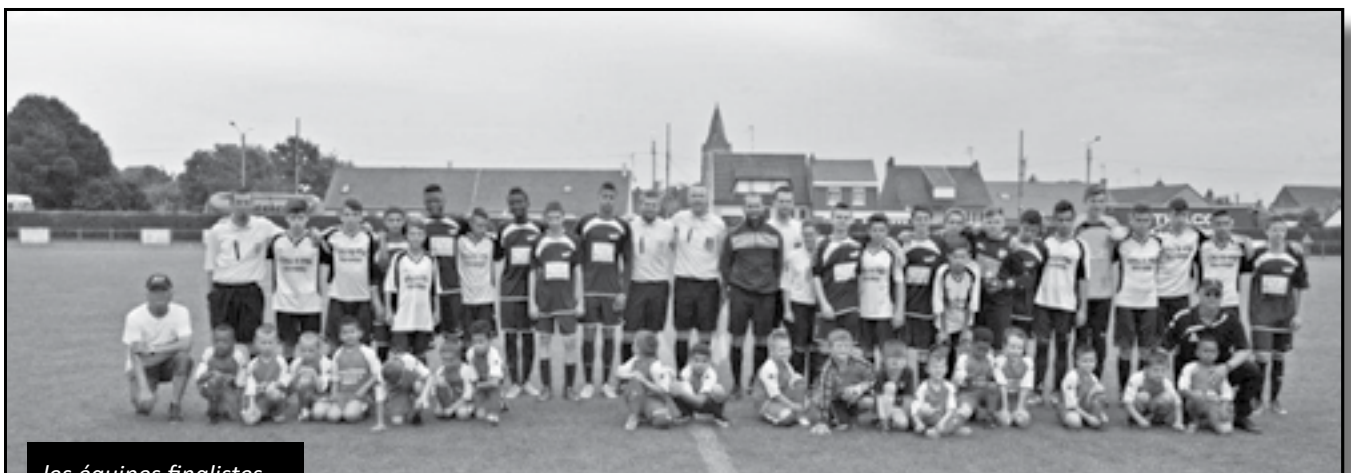
les équipes finalistes

Le club remercie la ville d'Escaudain et tout son personnel pour l'aide apportée à ce tournoi.