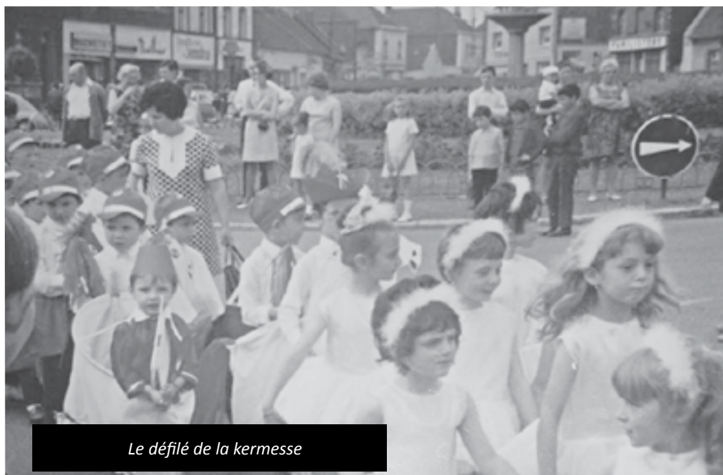
Le défilé de la kermesse