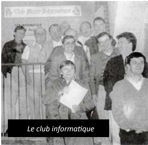
Le club informatique