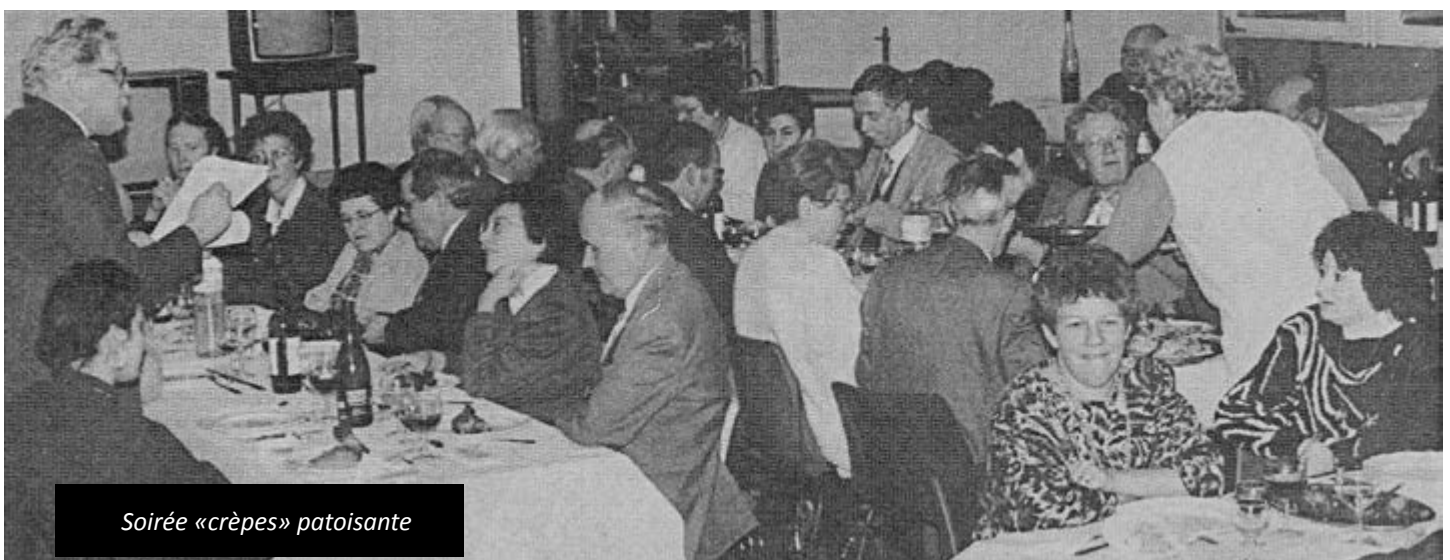
Soirée «crêpes» patoisante