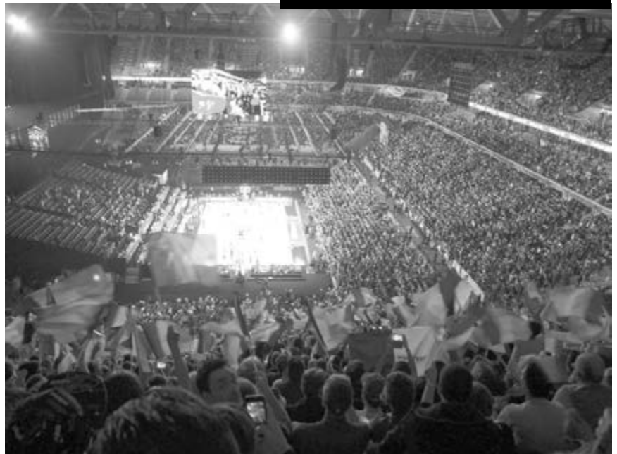
Le stade Pierre Mauroy plein à craquer

programme. Le premier : Pologne-Espagne pour se mettre en forme. Après avoir dégusté le panier pique-nique place au second match France-Turquie. Quelle ambiance dans ce stade ! ovation, hola, cris... Cela commence par l'entrée des joueurs, puis les hymnes nationaux dont la marseillaise chantée par des jeunes en délire. C'est à ce moment là, que le travail mené autour de la citoyenneté à travers ce pro-