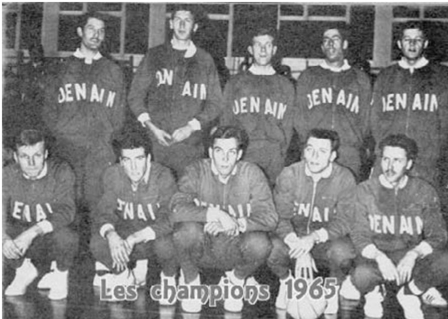
Les champions 1965

Tout ceci au fur et à mesure de mes retours chez moi disparaît, je ne retrouve plus ces gens dévoués, le bénévolat disparaît... (à Suivre)