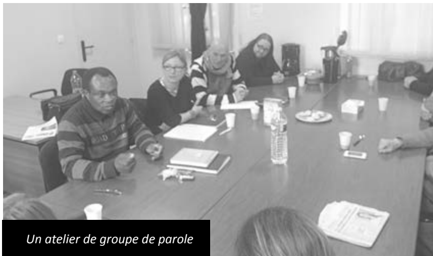
Un atelier de groupe de parole

Noter que tous ces projets sont réalisés en collaboration avec plusieurs partenaires fortement impliqués sur la commune. Parmi eux figurent l'Etat, l'Education Nationale, le Conseil Départemental, la CAPH, la ville d'Escaudain, la CAF du Nord et bien d'autres.