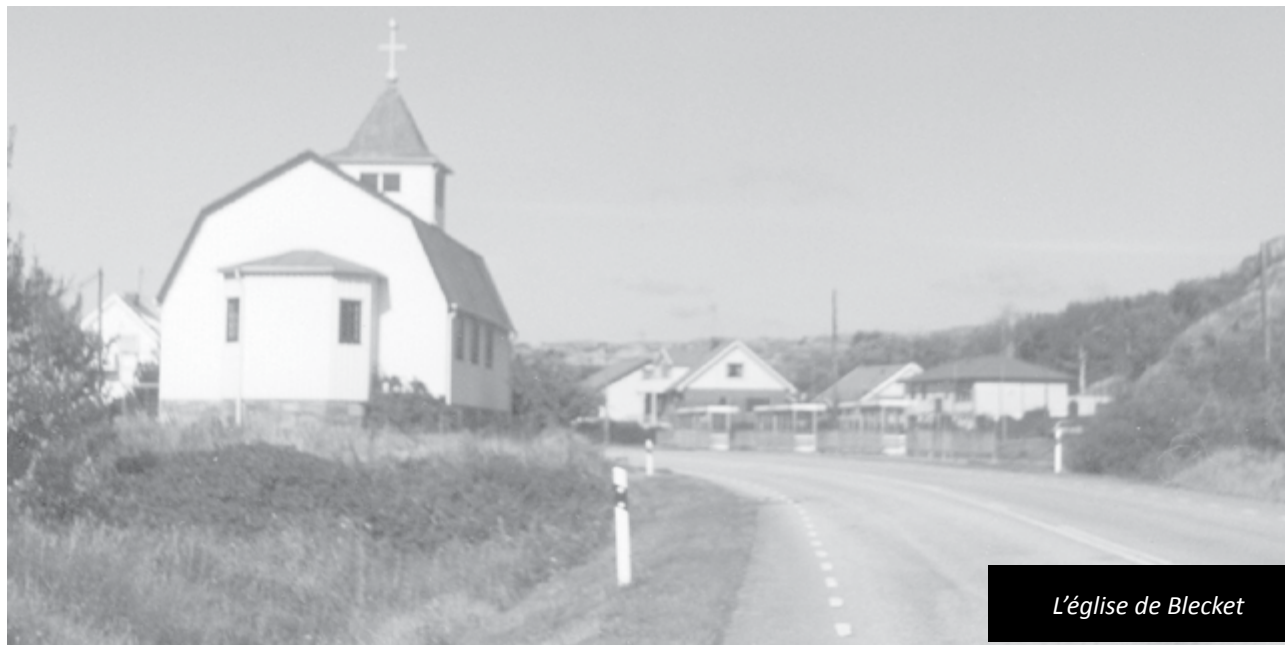
L'église de Blecket