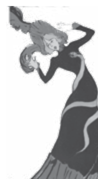
Jane Avril peinte par Toulouse Lautrec

« L'automne est le printemps de l'hiver » est de Toulouse Lautrec.