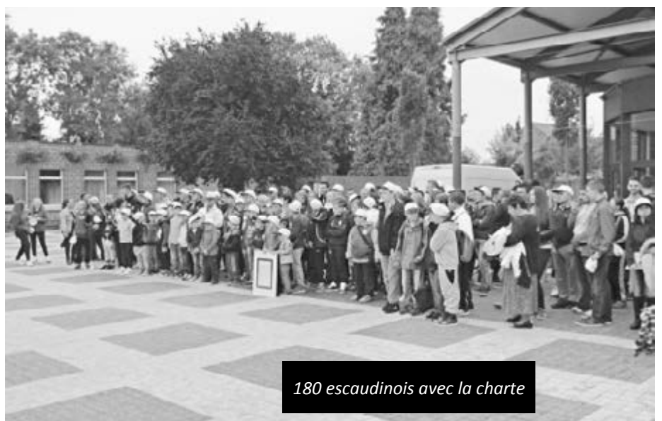
180 escaudinois avec la charte